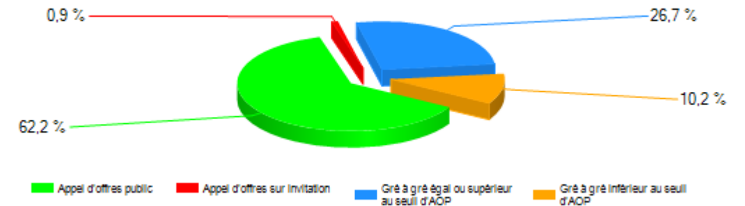
Proportion en valeur des contrats par mode de sollicitation en 2024-2025

À noter que les données présentées au volet 1 pour des contrats en technologies de l'information comprennent des contrats d'approvisionnement et des contrats de services.