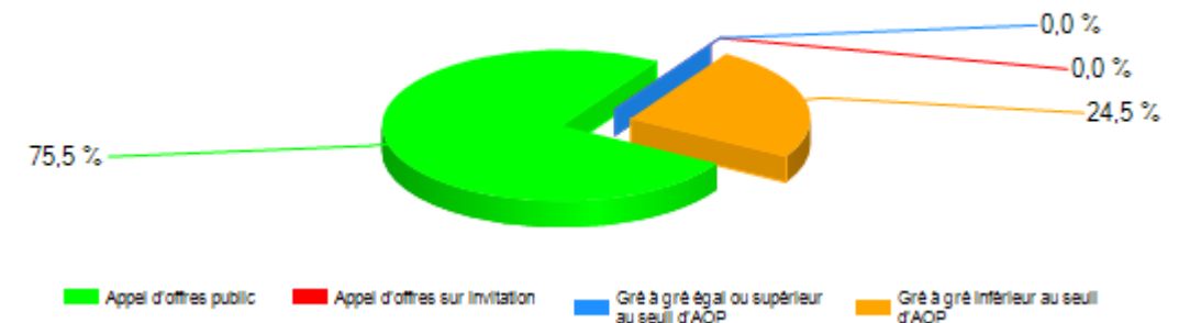
Proportion en valeur des contrats par mode de sollicitation en 2024-2025

À noter que les données présentées au volet 1 pour des contrats en technologies de l'information comprennent des contrats d'approvisionnement et des contrats de services.